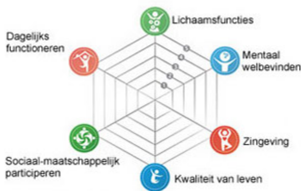
Figuur 1: Positieve gezondheid

Deze zes hoofddimensies hebben een onderverdeling in 'aspecten' (zie figuur 1).