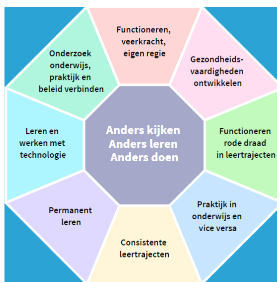
Figuur 4: Anders kijken, anders leren, anders doen

De gecombineerde veranderde kijk op gezondheid en (organiseren van) persoonsgerichte zorg en begeleiding stelt de huidige maatschappij voor een enorme uitdaging, met de professionals die veelal als eerste en langdurig contact onderhouden met cliënten, voorop. In het rapport 'Anders kijken, anders leren en anders doen' schetst de commissie Innovatie Zorgberoepen & Opleidingen daarom ook kaders voor het nieuwe, multidisciplinair en multilevel opleiden (van Vliet, Grotendorst, & Roodbol, 2016). De toerusting van professionals kenmerkt zich steeds meer door samenhang tussen vakbekwaamheid, samenwerkend vermogen en lerend vermogen (zie figuur 4).