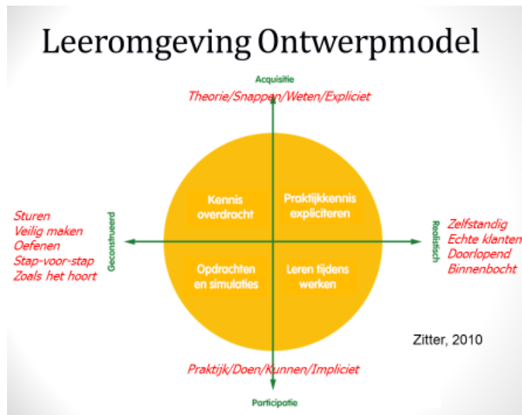
Figuur 5: Hybride leren

In figuur 5 wordt weergegeven dat er vier kwadranten te definiëren zijn die het hybride leren kenmerken: